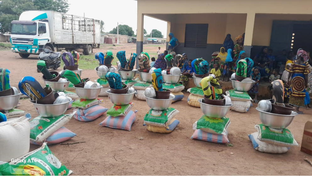
Distribution de vivres et non vivres aux familles d'éleveurs venues de Vinadouo (Burkina Faso) pour se réfugier à Kalamon (Côte d'Ivoire) suite à conflit foncier. Cette activité a été réalisée dans le cadre du FIL. Mai 2025

Le FIL peut, sous conditions, être mobilisé sur d'autres thématiques liées aux facteurs de vulnérabilité (chocs climatiques localisés, urgence sanitaire, prévention de tensions), à condition de maintenir un périmètre clair et des critères de priorisation partagés. Il répond également à une attente croissante des partenaires techniques et financiers : opérationnaliser la localisation de l'aide via des mécanismes concrets conciliant flexibilité, rigueur et alignement institutionnel.